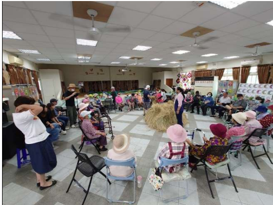
文健站長者們一起將稻草編織掃把 (8/17)