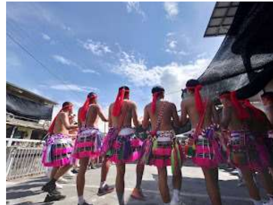
太巴壠部落傳統豐年祭 (8/20)