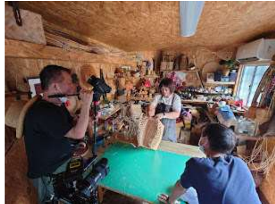
原住民傳統竹藤編工藝 (8/18)