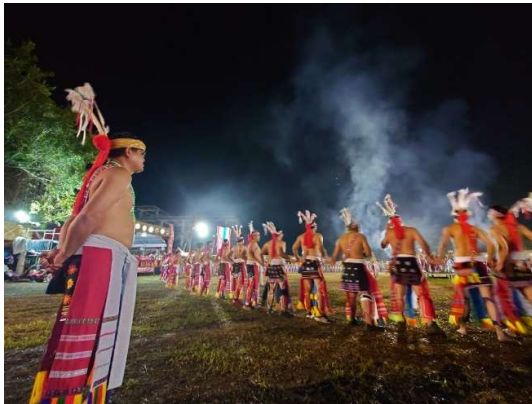
馬太鞍部落傳統豐年祭 (8/19)